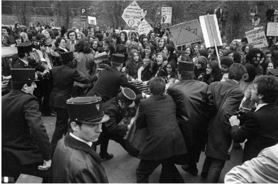
* Manifestation devant le tribunal de Bobigny